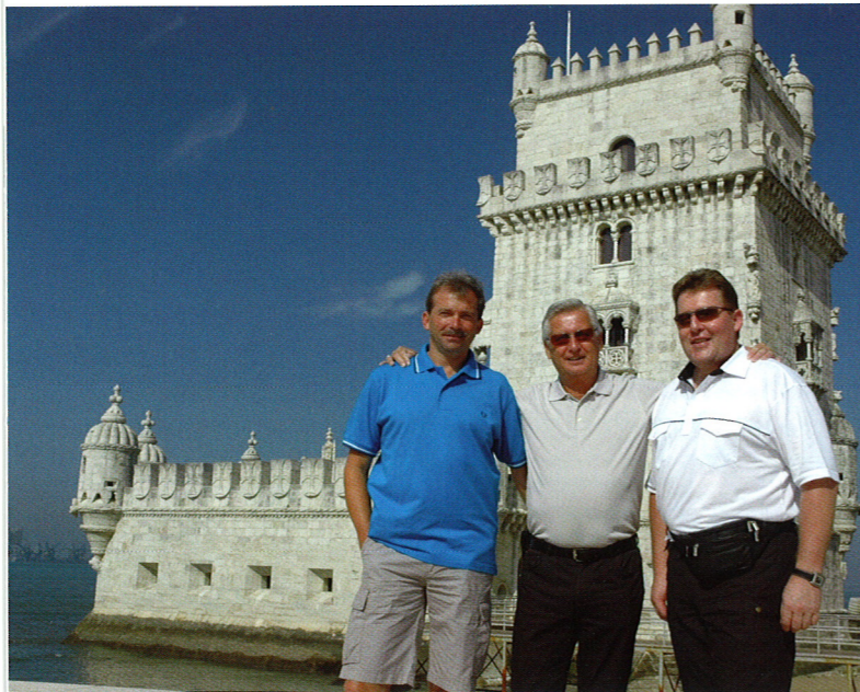
Zuerst wurde der Torre de Belém erobert, dann ging es in einem schnittigen Cabrio ein Stück ins Landesinnere nach Sintra.

Staffel-Wettbewerb 18. bis 21. Juni 2009